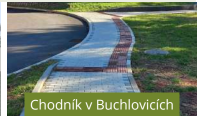
Chodník v Buchlovicích