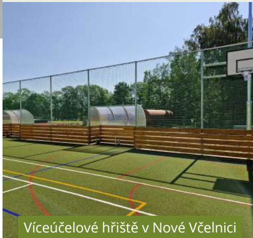
Víceúčelové hřiště v Nové Včelnici

Pavla Večeřová, starostka městyse Buchovice