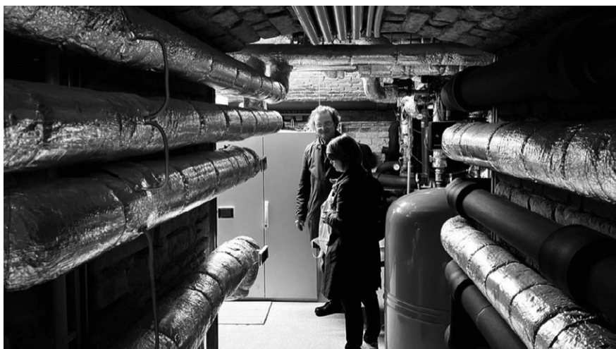
Vytápění vídeňského distriktu Hernals formou obnovitelného zdroje – dřevní štěpky je „meisterstückem“ v oblasti energetických strategií našich jižních sousedů.

dobrá větrnost a žádné další bariéry, měla by vzít v potaz potenciál výstavby větrných turbín. To samé pak např. u vody, biomasy a dalších zdrojů. Současné legislativní či byrokratické překážky nemohou být důvodem, proč do střednědobé koncepce nějaké téma nezařadit.