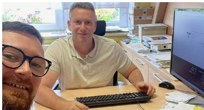
Návštěva obce Lhotsko

Řada starostů uvítala v červenci pomoc krajských manažerů SMS ČR s registrací do systému eDoklady. Několik takových obcí navštívil také manažer ve Zlínském kraji. Ještě na začátku měsíce bylo v území, kde působí, 30 obcí, které se do systému eDokladů nezaregistrovaly.