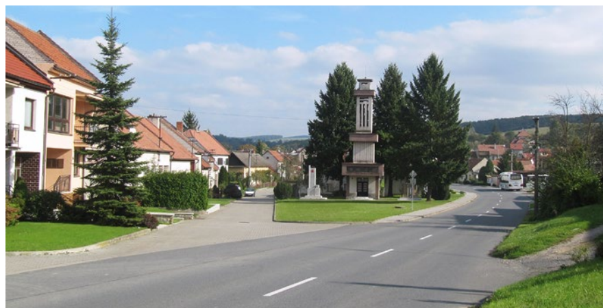
Obec Nadachlebice na Uherskohradištsku má 784 obyvatel a v roce 2025 se pyšní titulem Vesnice roku Zlínského kraje. Svým obyvatelům nabízí kompletní zázemí pro kvalitní život, je rovněž vzorem v nakládání s odpady.

Kontejnerové stavby mají v rozvoji obce potenciál i do budoucna – příprava sice trvá několik měsíců, ale samotná realizace je velmi rychlá. Provozní zkušenosti ukazují, že i takové budovy splňují vysoké standardy a poskytují kvalitní zázemí. Ostatním starostům a představitelům samospráv, kteří zvažují podobné inovativní přístupy, bych doporučil, aby se kontejnerových řešení nebáli. Finančně to může vyjít velmi dobře, zvláště pokud si necháte zpracovat více nabídek. My jsme díky výběrovému řízení získali cenu téměř o třetinu nižší, než byla původní nabídka. Kontejnery jsou tedy dobrá volba a rozhodně bych do toho šel znovu.