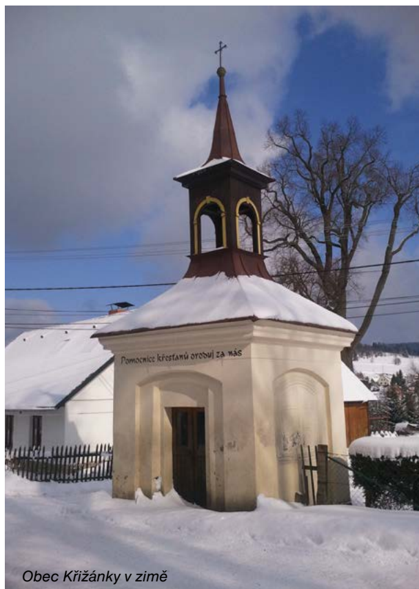
Obec Křížánky v zimě

Schválen: 24. listopadu 2015 Platnost od: 14. prosince 2015 Účinnost od: 1. července 2016