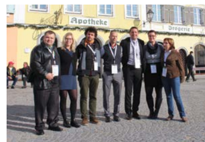
Společné foto české delegace

Národní delegáti Evropského venkovského parlamentu budou požadavky Manifestu ve spolupráci s národními a evropskými partnery prosazovat a komunikovat a úrovní národních a regionálních vlád a institucí.