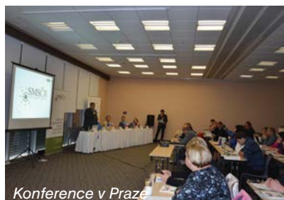
Konference v Praze

V průběhu října a listopadu se tyto akce postupně odehrály na sedmi místech, kde se odehrávaly hlavní aktivity projektu. Bylo do něj zapojeno 72 místních akčních skupin s více než 2000 obcí a měst. Cílem projektu bylo nejen vzdělávat, ale také plánovat a připravovat konkrétní formy spolupráce. Všechny zapojené MAS tak nyní mají zpracovanou „strategii spolupráce obcí“, která pomůže při přípravě projektů nového programovacího období.