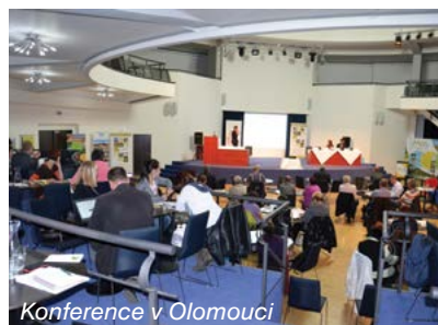
Konference v Olomouci