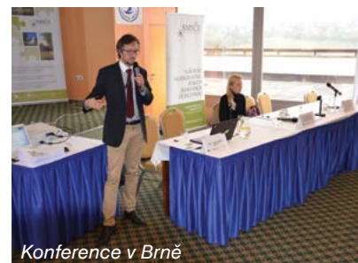
Konference v Brně