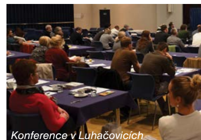
Konference v Luhačovicích