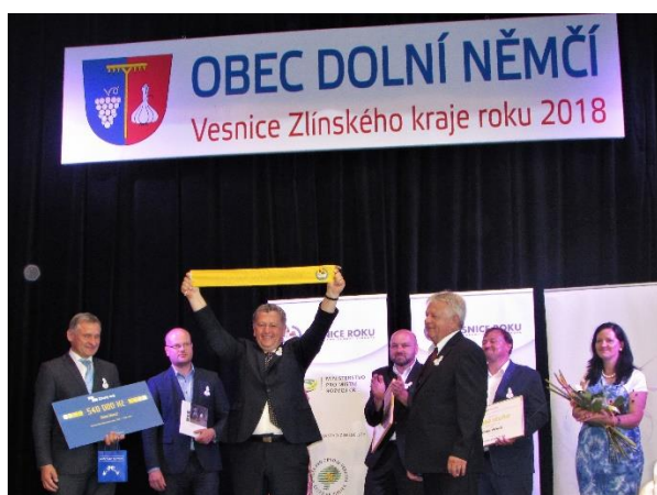
Zlatá stuha – Dolní Němčí