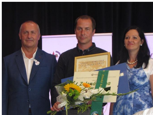
Zelená stuha – Velehrad