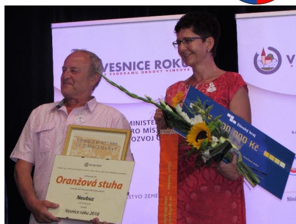
Oranžová stuha – Neubuz