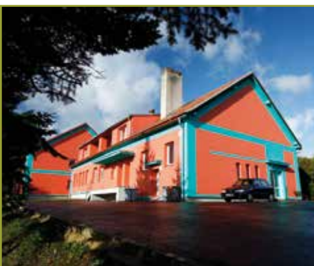
Základní a mateřská škola v malé obci Vysoké Pole na Zlínsku.

Podklady včetně petičních archů naleznete na www.smscr.cz . Podpisy se shromažďují do 10. dubna t. r.