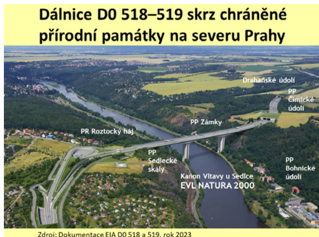
Dálnice D0 518–519 skrz chráněné přírodní památky na severu Prahy

Proti stavbě vystupují dotčené obce a městské části, které varují před negativními dopady. Často se proti nim argumentuje veřejným zájmem