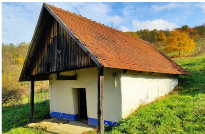
Před obnovou

Vinná bída ve Veletinách leží na území Vesnické památkové rezervace Veletiny – Stará Hora. Kulturní památka, které se nachází na území vesnických památkových zón či vesnických památkových rezervací, mají možnost obnovu financovat pomocí dotací z Programu péče o vesnické památkové rezervace, vesnické památkové zóny a krajinné památkové zóny. Tento program Ministerstva kultury ČR je určen na podporu obnovy a zachování nemovitých kulturních památek, zejména na památky lidové architektury, jako např. zemědělské usedlosti, chalupy, kapličky, boží muka, ale i např. venkovských kostelů zámečků, soch apod.