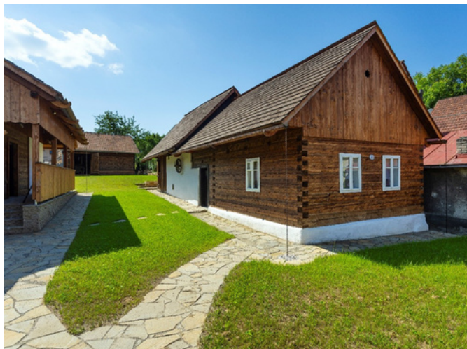
Po obnově

V úterý 3. září 2024 se v prostorách expozice Bařova mrakodrapu ve Zlíně uskutečnilo slavnostní vyhlášení uznání Lidová stavba roku Zlínského kraje. Toto prestižní ocenění je udělováno každoročně Zlínským krajem. Je určeno pro stavby lidové architektury, které jsou opraveny s použitím tradičních technik a materiálů a které se vyznačují vysokou úrovní řemeslného zpracování. Ocenění „Lidová stavba roku Zlínského kraje“ je důležitým příspěvkem k ochraně a propagaci našeho stavebního dědictví a je důkazem toho, že tradiční stavitelské techniky a materiály stále hrají důležitou roli v současném stavitelství.