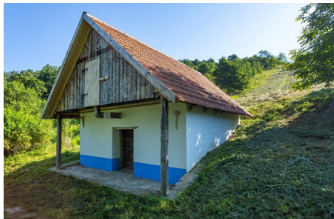
Po obnově

Ve Zlínském kraji máme 3 vesnické památkové rezervace: Rymice-Hejnice, Veletiny – Stará Hora, Vlčnov-Kojiny a 3 vesnické památkové zóny: Kychová, Velké Karlovice – Podfaté a Zděchov. Návrhy na zařazení do programu se podávají do každoročně do konce ledna. Více informací najdete zde: https://mk.gov.cz/program-pece-o-vesnicke-pamatkove-rezervace-vesnicke-pamatkove-zony-a-krajinne-pamatkove-zony-cs-284 ; případně Vám rádi pomohou pracovníci oddělení památkové péče Krajského úřadu Zlínského kraje.