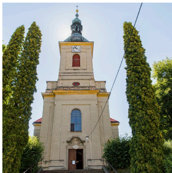
Kostel Nanebevzetí Panny Marie, Strážka

Otevřené brány představují úspěšný projekt, který si získal oblibu veřejnosti a patří už k nedílné součásti turistické nabídky ve Zlínském kraji.