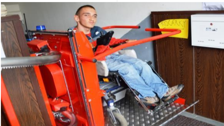
ZŠ a SŠ Slezské diakonie Krnov, Moravskoslezský kraj, 2015