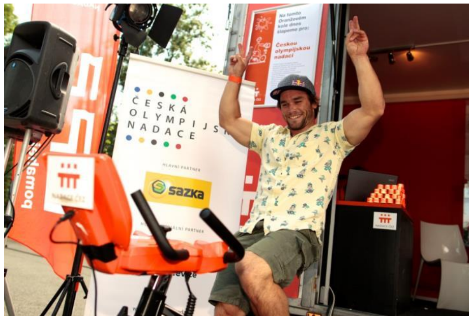
Vavřinec Hradilek, olympijský vítěz v kanoistice Pomáhej Pohybem, Festival Sportu Plzeň 2015