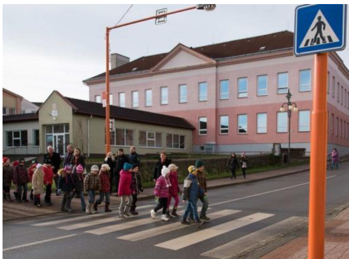
Oranžový přechod Hrotovice – Vysočina, 2015