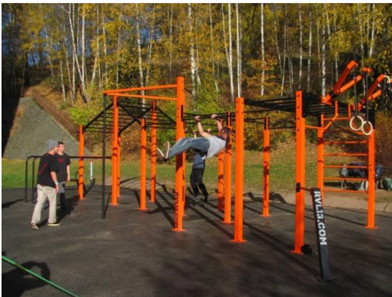
Oranžové workoutové hřiště Náchod Královéhradecký kraj, 2015