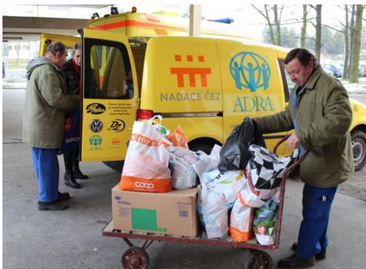
ADRA, Energie pro ADRU provoz sociálních šatníků v MS kraji