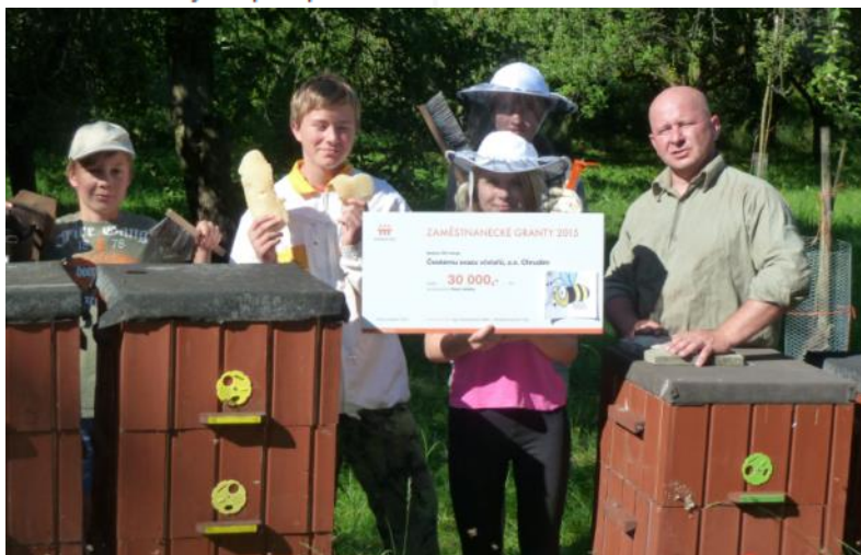
Český svaz včelařů ZO Chrudim