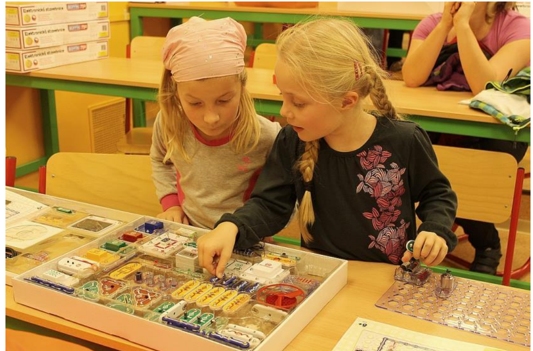
Základní škola TGM Hrádek nad Nisou