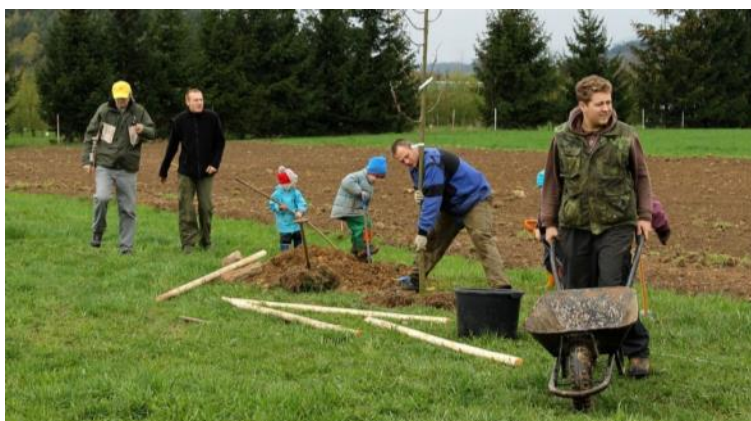
Janův Důl, výsadba stromů, Liberecký kraj 2015